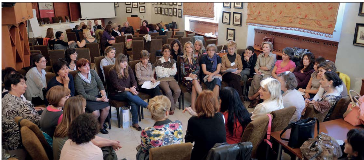
ŠIROKO PARTNERSTVO: Sastanak Mreže podrške

Inkluzija, koja uvodi standard jednako kvalitetnog obrazovanja za sve, više nije novost u domaćoj prosveti. Međutim, šta se dešava kada se učenici sa specijalnim obrazovnim potrebama nađu na prelazu iz osnovne u srednju školu