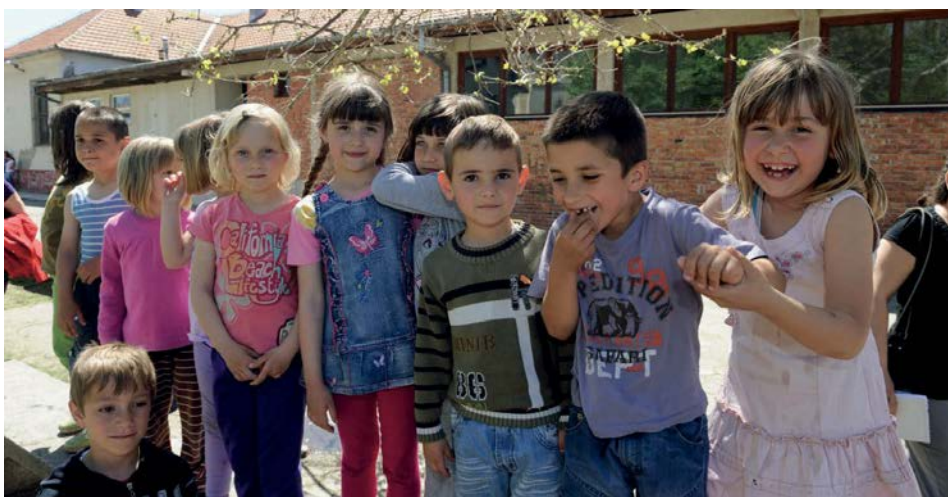
UČENJE JE MOGUĆE KROZ IGRU

U Srbiji je trenutno 48 odsto dece, ili 84.000 od 177.000 dece ovog uzrasta upisano u vrtić, dok 93.000 dece istog uzrasta nije obuhvaćeno predškolskim obrazovanjem. Nacrt nacionalne strategije za razvoj obrazovanja do 2020. ciljnu stopu obuhvata postavlja na 75 odsto, što bi značilo povećanje broja upisane dece od oko 40.000. Stopa obuhvata predškolskim obrazovanjem ima rastući trend – danas je oko 25 odsto viša nego što je bila 2005. godine. Međutim, stručnjaci ovaj rast stope objašnjavaju smanjenjem broja dece, a ne povećanjem kapaciteta predškolskih ustanova. Uz to, struktura dece koja pohađaju vrtiće, kada je reč o socijalnim kategorijama, ukazuje na to da je pristup vrtićima deci iz bogatijih porodica