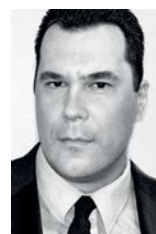
Piše: Dr Neven Cvetičanin

Umesto toga da glavna briga prosvete bude kako odškolorati kvalitetne kadrove koji mogu poslužiti razvoju zemlje, kod nas je glavna briga prosvete da popuni socijalne rupe, pa je veoma česta pojava da nekoga ko je ostao bez posla u drugim sektorima gurnemo u prosvetu kako bi bio na državnom budžetu, pri čemu je manje bitno kakve kvalifikacije poseduje i kakvo znanje može da prenese učenicima